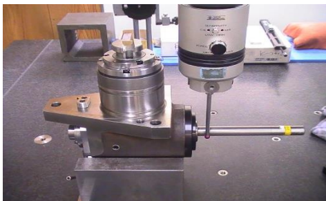
三次元測定機による静的試験 検査項目 例