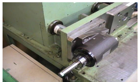
回転試験機による動的試験 回転試験機による検査項目 例